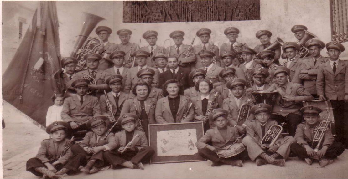
- La Banda amb el primer premi obtingut al certamen d'Ontinyent a l'any 1943 -