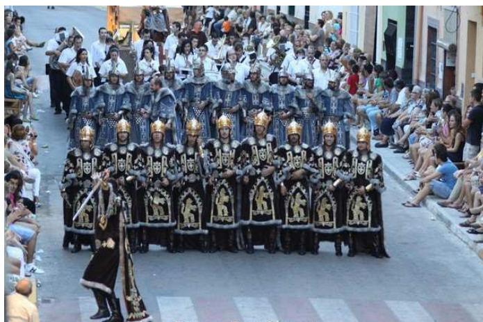
- La banda a una entrada cristiana -

Amb aquesta imatge tanquem el capítol d'activitats de la banda als nostres dies.