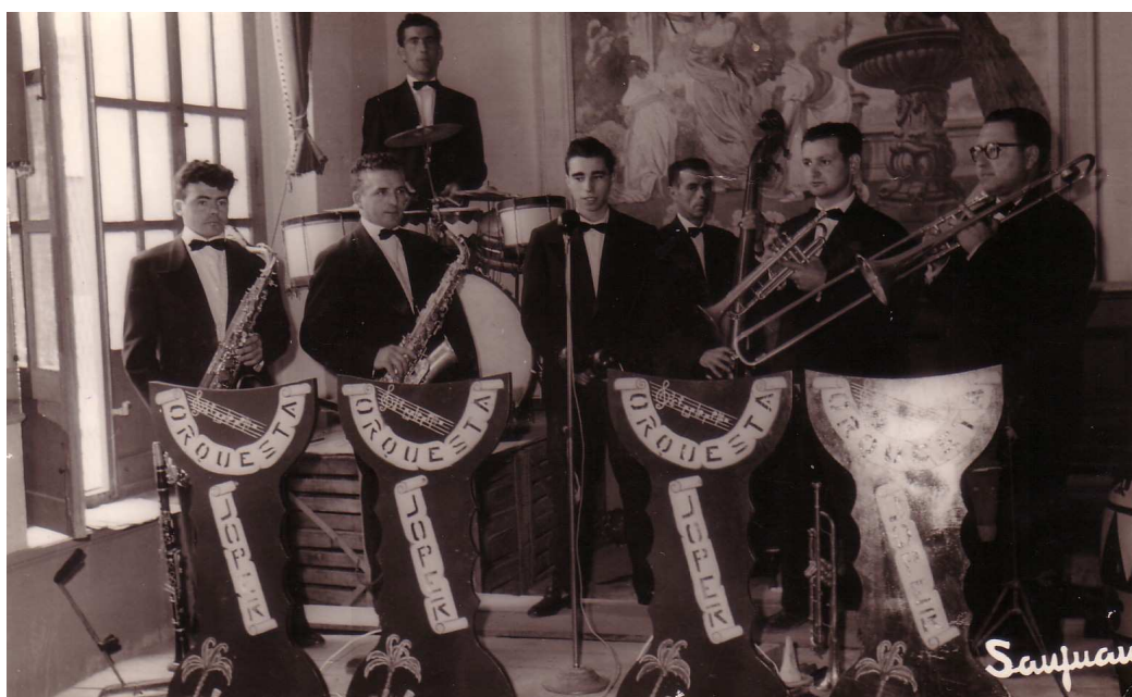
- Orquestra Joper -

Amb tot, hem repassat els fets que considero més representatius i significatius de la nostra banda al llarg de la seva història més antiga.