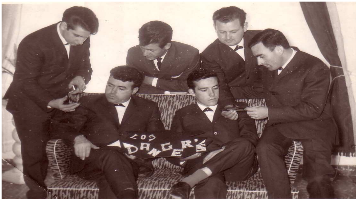
- Los Dangers -

Aquí tenim dos d'aquests grups, què van fer ballar i cantar a aquelles generacions amb les seves actuacions als escenaris de tota la nostra geografia: